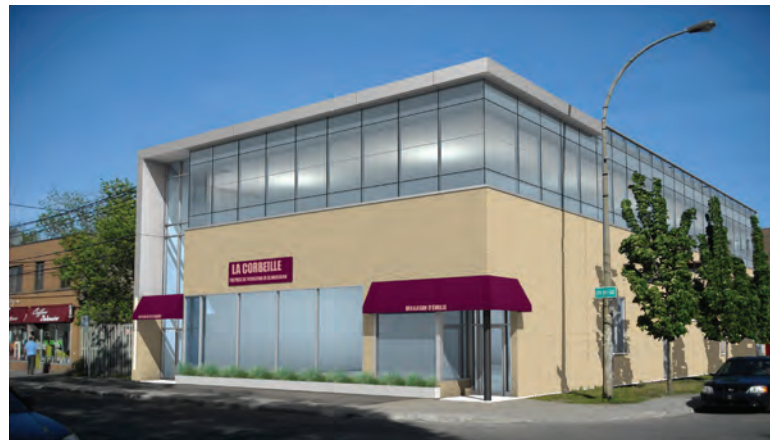
La Corbeille Bordeaux-Cartierville, ajout d'un étage

quartier d'une structure permanente en sécurité alimentaire et de bonifier l'offre et les services actuels, la Corbeille a ajouté un deuxième étage à son édifice de la rue Dudemaine. La réalisation de ce projet essentiel à la qualité de vie de nombreuses familles du quartier a été financée en grande partie grâce à la générosité des donateurs de la Fondation Gracia.